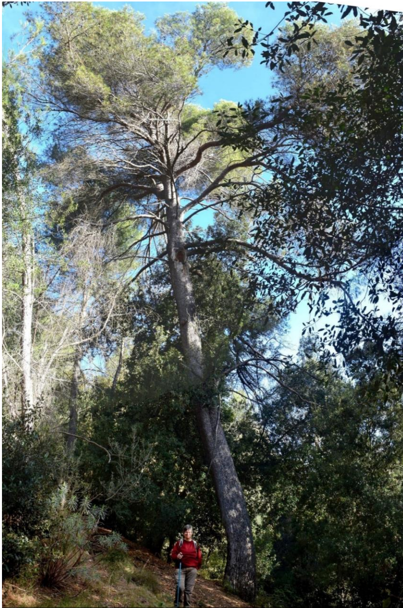
Pi blanc de la Font d'en Merlès