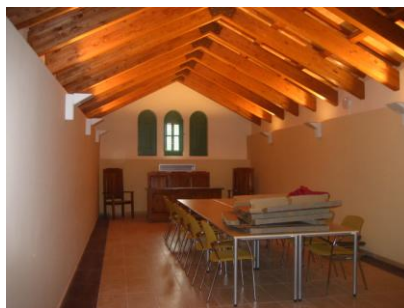
Vista general de Les Golfes

Sala Polivalent "Les Golfes" on vàrem realitzar part de la "Passejada Poeticoliterària" del passat dia 22 de desembre.